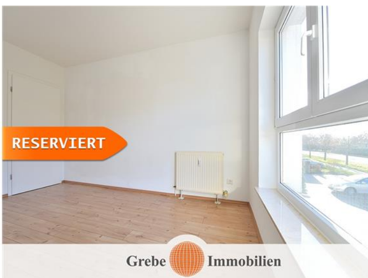
Schlafzimmer Bild 2