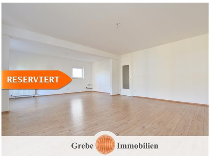
WZ mit Küche Bild 2