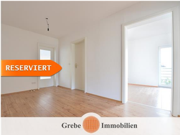
Flur Bild 2