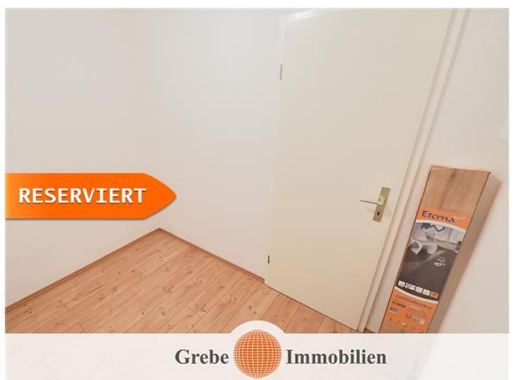
Abstellraum am Flur