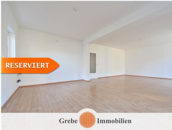
Familienzentrum Bild 3