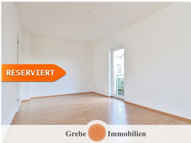
Arbeitszimmer Bild 2