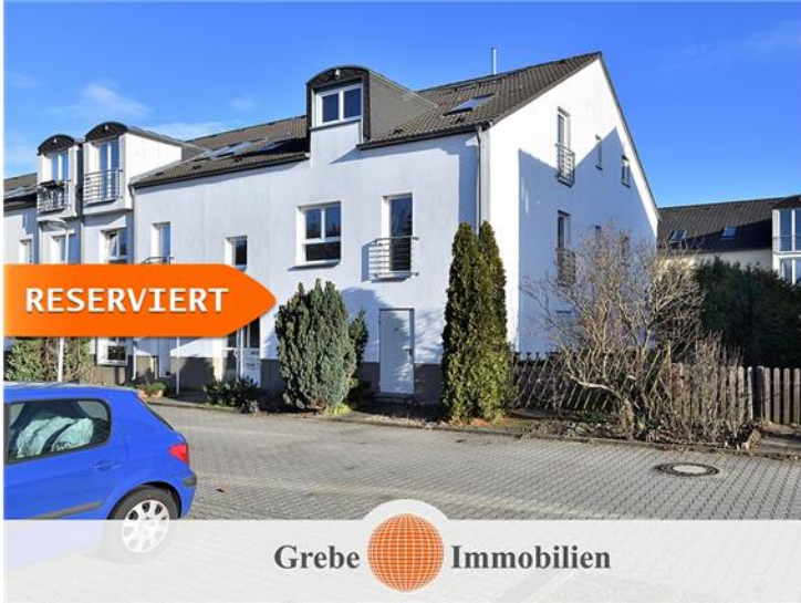
Johnepark 79 C